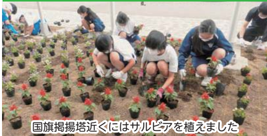
国旗掲揚塔近くにはサルビアを植えました