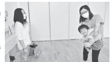
第2回子育てサロン「ぽかぽかテラス」親子ヨガ教室の様子