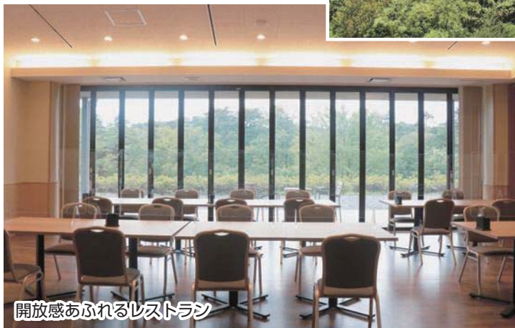
開放感あふれるレストラン