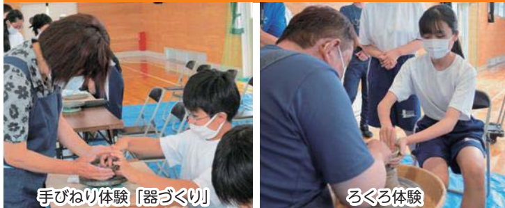
手びねり体験「器づくり」