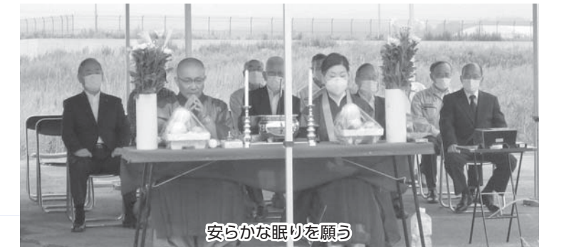
安らかな眠りを願う

7月2日、旧請戸共同墓地に整備する「先人の丘」の工事のため、横山建設株式会社が主催する慰霊祭が行われました。津波により倒壊・流出した請戸共同墓地が、先人たちを敬う場所や慰霊の場所となるように、安全に整備を進めていきます。