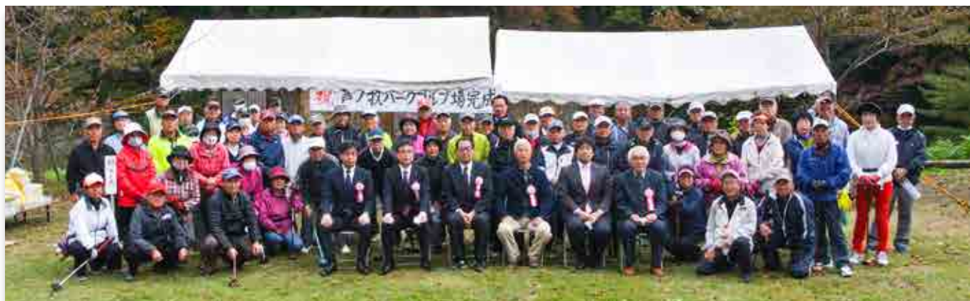
(上の写真) パークゴルフ場の完成を祝う関係者 (下の写真) 競技を楽しむ愛好家

会津に暮らす町民と会津若松市民が協力して整備したパークゴルフ場が市内の芦ノ牧温泉近くに完成しました。会津若松市パークゴルフ協会が借り受けた私有地に完成したのは「鮎コース」「岩魚コース」各9ホール合計18ホール。敷地は川沿いの水力発電所関連施設の跡地を、自分たちで重機を使うなどしてパークゴルフ場に整備しました。同市内では初めての専用コースで、今後は競技を通じた住民同士の交流が期待されます。