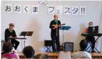
ヒロハワイアンズ