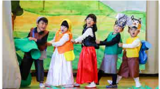
音楽劇を披露する園児

発表会は、感染症対策で来場者を制限するなど規模を縮小して開催しましたが、来場した保護者や関係者から大きな拍手が送られました。