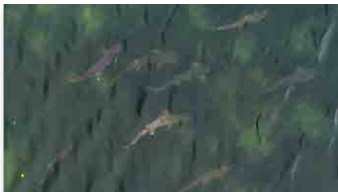
熊川に戻ってきたサケ

町内を流れる熊川で11月上旬、遡上してきたサケの姿が見られました。河口付近に数匹が集まって泳ぎ、時折水面で跳ねて水しぶきを上げていました。震災後も変わらずふるさとの川に戻ってきたサケが、町内に秋の深まりを知らせていました。