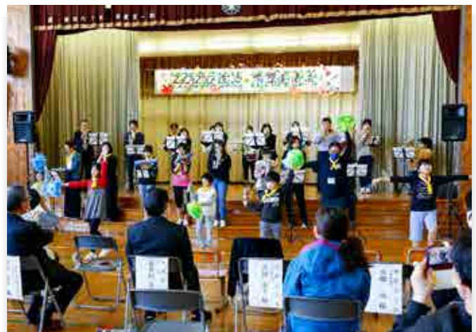
鼓笛演奏を行う児童と教職員、保護者ら