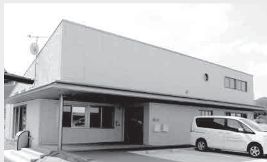
町立診療所として整備する建物