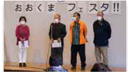
大熊町老人クラブ連合会

町社会福祉協議会主催の町民交流会「つながっぺ！おおくまミニフェスタ」が11月16日、いわき市の新舞子ハイツで開催され、町民約60人が参加しました。