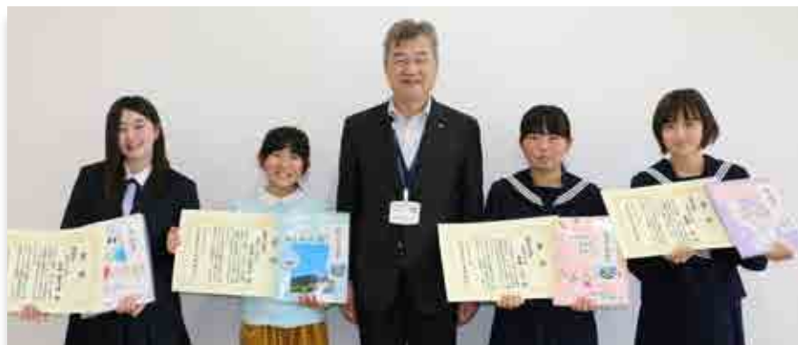
コンクールで表彰された児童・生徒