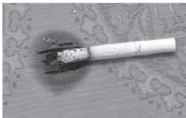
たばこ火災の始めは、炎が出ず燃焼が徐々に広がります！