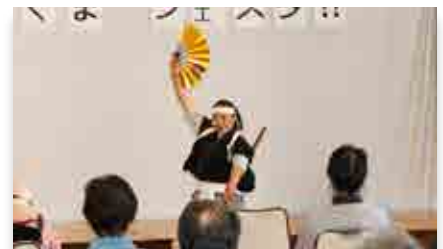
天山流吟剣詩舞道