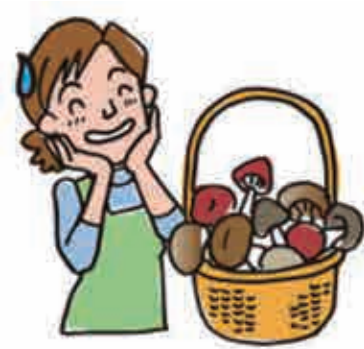
図；出典；放射線・放射性物質Q&A（3）；長崎大学

もし放射線に関する疑問や質問がありましたら、大熊町役場を通じて、長崎大学のスタッフに、お気軽にお問い合わせください。