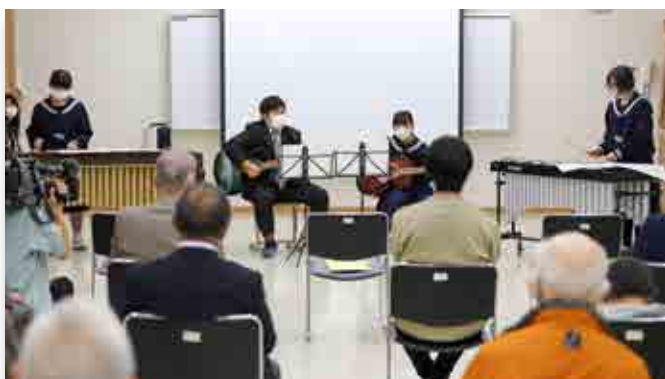
全校合奏を行う生徒と教職員

町立大熊中の文化祭である柏陽祭が10月24日、会津若松市の仮設校舎で開かれました。