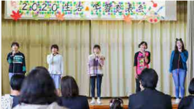
歌を披露する児童

町立幼稚園と小学校が合同で行う生活・学習発表会が10月24日、会津若松市の同小体育館で開かれました。