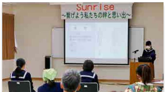
ふるさと創造学の成果を発表する生徒

今年は「Sunrise ～繋げよう私たちの絆と思い出～」をテーマに、ふるさと創造学、読書感想文の学習発表を行ったほか、全校合奏ではハンドベル演奏とギター、シロフォン、マリimbaによる合奏を披露しました。