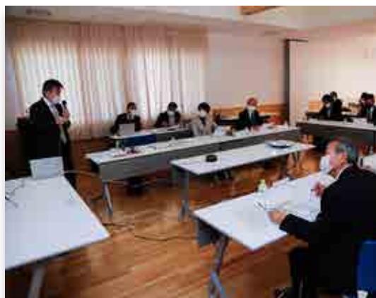
初会合で意見を交わす委員