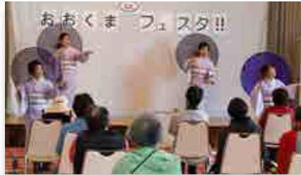
醍醐の会 はまなす