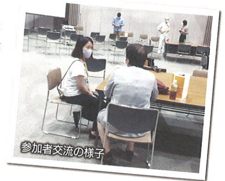
参加者交流の様子

いたかった。仙台の人だけでなく全国に、浪江にあったパン屋として、知ってもらいたい、来てもらいたい。パンを通して震災の記憶の共有ができればうれしい」「今でも週に1回は浪江町にパンを届けていて、今日も午前中は浪江にパンの販売に行っていた。浪江の人になじみのパンを届けることは自然なこと」だとお話されました。