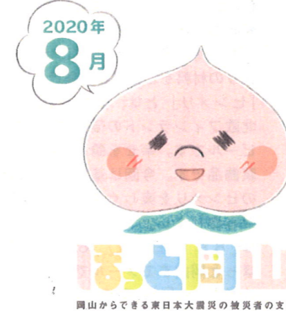
岡山からできる東日本大震災の被災者の支援

2020年8月1日発行 編集・発行：一般社団法人ほっと岡山 岡山市北区東古松 1-14-24 コーポ錦1階 電話：070-5670-5676 メール：office.hotokayama@gmail.com