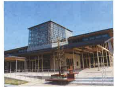
いいたて村の道の駅までい館▶