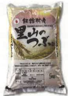
飯館村産米 2017年より販売を開始しました