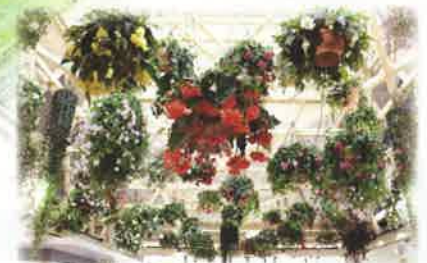
いいたて村の道の駅までい館 ままでいホール