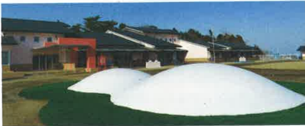
園舎とふわふわドーム

子どもたちが外で元気いっぱい遊べる、魅力ある遊具を設け、未来の富岡町を担う子どもたちの教育・保育を一体的に行う施設として期待されています。