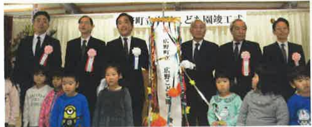
広野こども園竣工式

子どもたちが成長を実感できるようなスケール感でデザインされ、子どもたちが自由に考え、豊かな心を養える施設として期待されています。