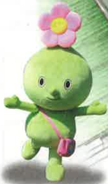
飯館村公式キャラクター イタネちゃん