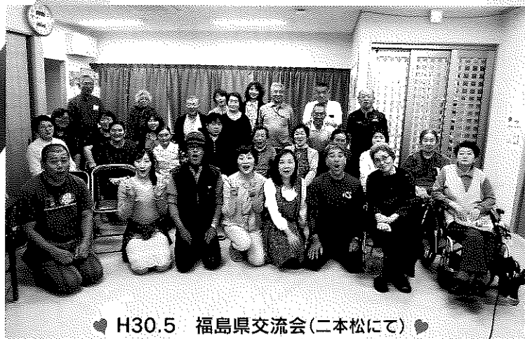
♥ H30.5 福島県交流会(二本松にて) ♥