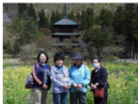
安久津八幡神社 三重塔