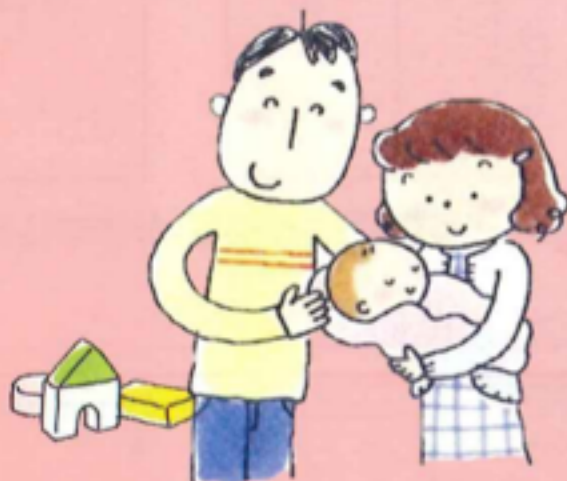
イラスト/森川ちかこ氏

キュッと歯を食いしばるより 表情をゆるめて暮らせるように心がけていると… 子どもの表情も不思議と笑顔でいっぱい! 頑張りすぎず、時には地域の力を借りながら ありのままの子育てを楽しんでください。