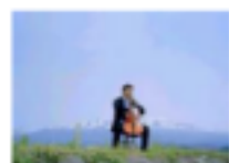
おくりびとのロケ地