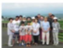
後方に見えるはずの鳥海山が...