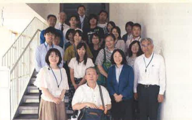
「官民協働でつなげる広域避難支援」を考えるシンポジウムの参加者の皆さんと

「ふうあいおたより」の発行（3回/年）、交流会の企画・運営・広報のお手伝い、悩みごとの相談（よろず相談）などを中心に活動しています。