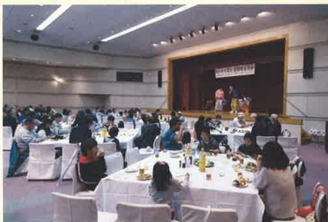
昨年の全県避難者交流会の様子

①官民40団体が協働しワンストップでの「日常の相談対応」、②全県避難者交流会や地域別交流サロンの開催および、各種団体からの招待イベント情報の告知と参加促進による「交流機会の提供と孤立防止」、③時間の経過や子供の成長などにより変化していく支援ニーズを把握するための「アンケート調査の実施」を通じ、避難者の皆様への継続的な生活再建支援に取り組んでいます。今年度の全県避難者交流会は10月21日（日）に開催します。