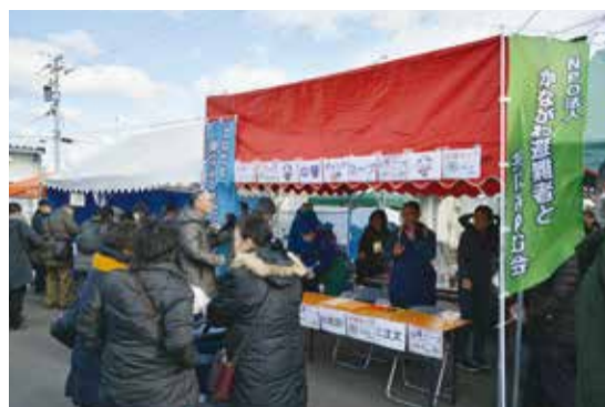
▲双葉町ダルマ市主催者「夢ふたば人」さんからの呼びかけもあり、2015年に屋台を初出店。今年で出店は4回目となる

ツアー参加者の方々にお話を聞いたところ「双葉町だけでなく、双葉郡全体のつながりを感じるためにも、このようなイベントは大切だと思う。今回参加してその思いが改めて強くなった」「仮設住宅広場での開催は最後と聞いたので参加した。屋台のお手伝いをしながら、お客さんと交流できて良かった」などの声がありました。