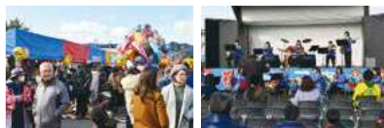
▲ダルマ市も大賑わい。ステージでは様々なイベントも