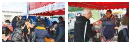
▲取材当日は少々肌寒く、屋台の餃子スープに人が集まった