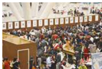
▲同日開催のふくしま大交流フェスタ。多くの来場者で賑わった