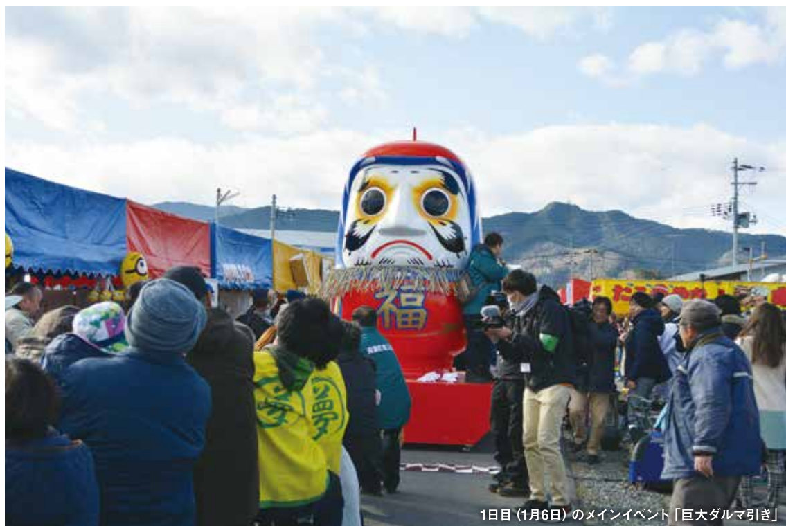
1日目(1月6日)のメインイベント「巨大ダルマ引き」

〒960-8062 福島県福島市清明町 1-7 大河原ビル 2F TEL.024-573-2732