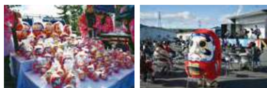
▲会場では多種多様なダルマを販売。ゆるキャラも登場した