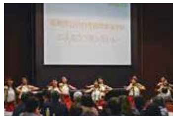
▲フラダンスショーや展示物等、交流会では様々な催し物を開催