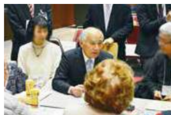
▲内堀県知事や吉野復興大臣も交流会の場に加わった