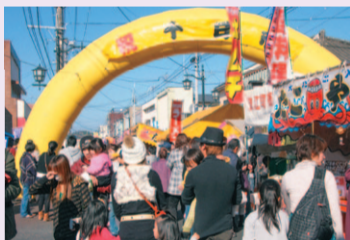
震災前の浪江町での十日市祭の様子

平成30年3月まで「絶景」「温泉」「食と日本酒」をテーマとした、「福が満開、福のしま。」ふくしま秋・冬観光キャンペーンを開催します。期間中は、地域で磨き上げた「特別企画」や各種イベントを県内各地で行います。「特別企画」には、7年ぶりに浪江町で行われる「復興なみえ町十日市祭」(11月25日・26日)や、檜葉町や川内村のイルミネーション(12月～1月)もあります。ぜひこの機会に福島県の秋・冬の魅力をお楽しみください!