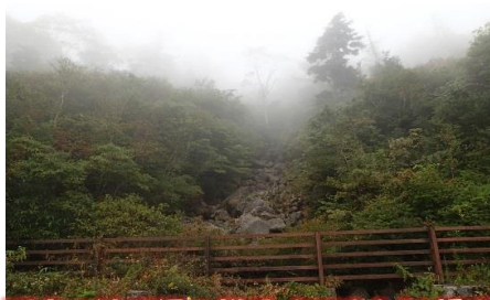
双竜の辻周辺の様子 (H28.9.16撮影)