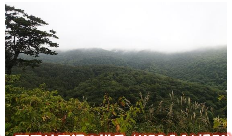
天風境周辺の様子 (H28.9.16撮影)