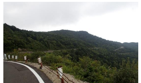
乙女沢周辺の様子 (H28.9.16撮影)