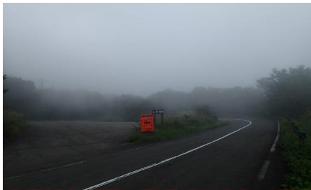
高湯温泉周辺の様子 (H28.9.16撮影)