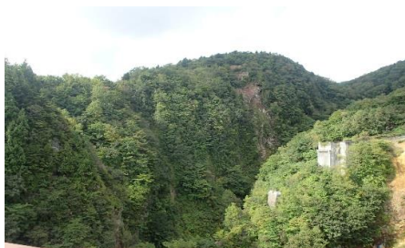
不動沢周辺の様子 (H28.9.16撮影)