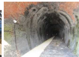
⑤親不知レンガトンネル