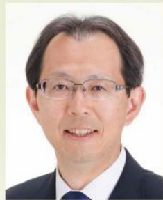
<パネリスト> 福島県知事 内堀 雅雄