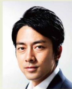
<パネリスト> ふたばの教育復興応援団 衆議院議員 小泉 進次郎 氏