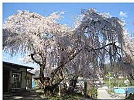
貝生公民館のしだれ桜

次回の交流会は、米沢市社会福祉協議会主催 温泉でほっこり・ゆっくりしませんか！？ です。