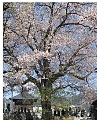
称明寺阿弥陀堂の桜(白鷹)