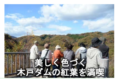
美しく色づく木戸ダムの紅葉を満喫