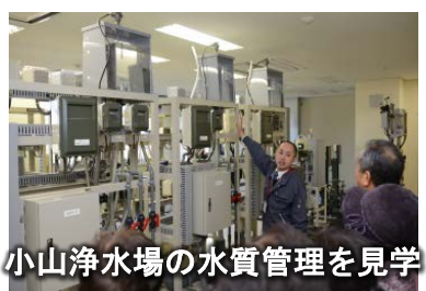
小山浄水場の水質管理を見学

ツアー中に行った座談会では、参加者から「浄水場の管理体制を知り水道水に対する不安が消えた」、「町の現状を確認でき復興を感じとれた」、「久しぶりに町に帰ってきて、ほっとした気持ちになった」などの声が聞かれました。