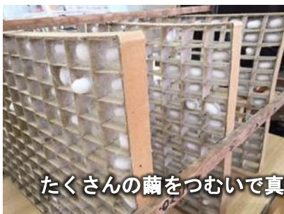
たくさんの繭をつむいで真っ白な絹糸にします。