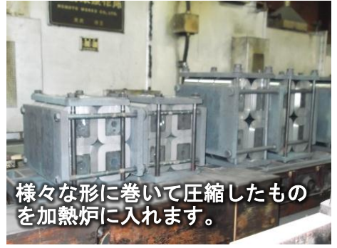
様々な形に巻いて圧縮したものを加熱炉に入れます。