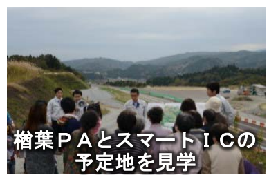
楡葉PAとスマートICの予定地を見学