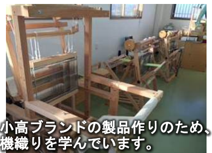
小高ブランドの製品作りのため、機織りを学んでいます。

※「芋こじ」：水と一緒に桶に入れた泥つきの里芋をかき回し、芋同士をぶつけて泥を落とすのと同じように、思いをぶつけ合って磨いていこう、というねらいで名付けました。