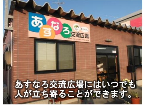
あすなる交流広場にはいつでも人が立ち寄ることができます。

来年からは養蚕の規模を拡大するとともに、将来的には絹製品の生産まで手掛けたいと考えています。そのため、糸をつむぐ技術や機織りの技術について、外部の方から技術支援を受けながら習得に努めています。