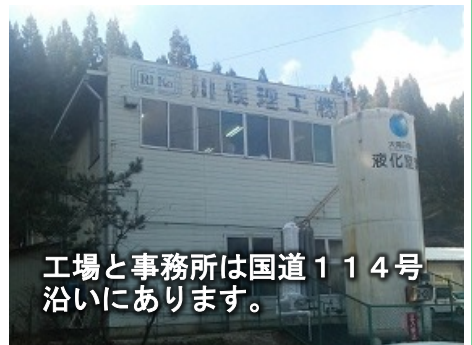
工場と事務所は国道114号沿いにあります。