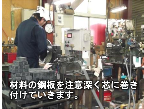
材料の鋼板を注意深く芯に巻き付けていきます。

少人数ながら退職してしまっただ従業員がいたこともあり、震災前に比べ生産が減っておりましたが、本年12月から2人の採用が