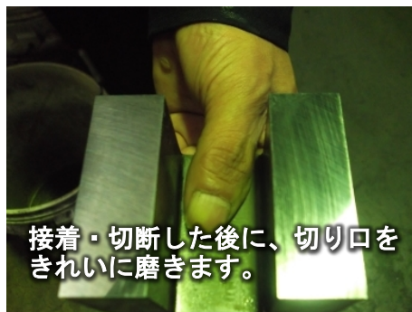
接着・切断した後に、切り口をきれいに磨きます。

これからも、懸命に仕事に取り組んでくれている従業員とその家族を大切にしながら、これまでお世話になってきた地域の皆さんと一緒にがんばっていききたいと思っています。