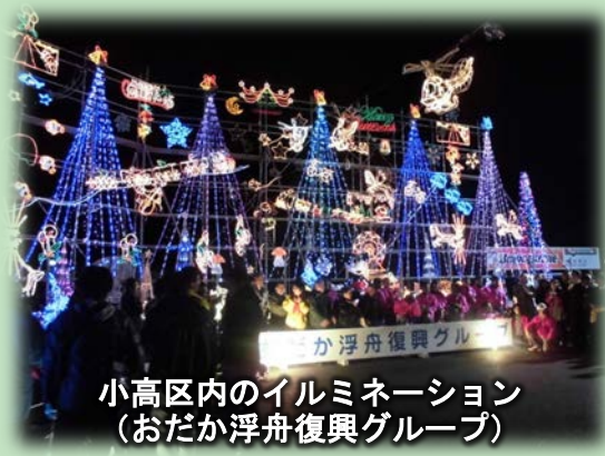
小高区内のイルミネーション (おだか浮舟復興グループ)

「あかりのファンタジーイルミネーション～あかりに託す復興への道しるべ～」と題し、11月28日から市内各地で点灯が開始され、たくさんの人にぎわいました。