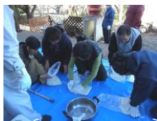
↑餅をのす ↓しめ飾りづくり