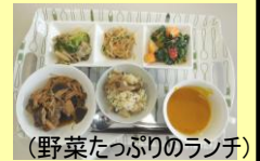
(野菜たっぷりのランチ)