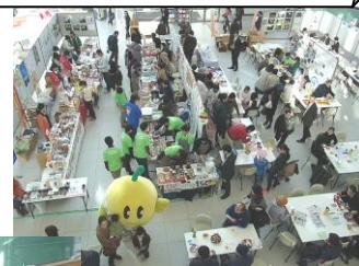
〔12月7日「縁joy・東北2014」出店〕