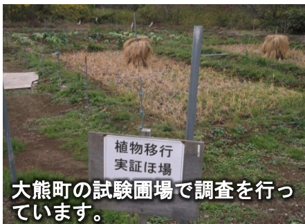
大熊町の試験圃場で調査を行っています。

この試験農場では将来の営農再開のため、イネと数種の野菜（大根、なす、かぼちゃ、さつまいも、レタス、白菜、トウモロコシなど）を用いて、表土を取り除くか否かや、カリウム肥料を与える量によって、放射性セシウムの取り込まれ方についての程度違いが出るか調査するため、大熊町と福島大学の共同で実証試験を行っています。