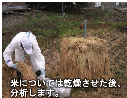
米については乾燥させた後、分析します。

平成24年に事業を開始しましたが、事業開始当初は1平方メートルくらいの水田と畑で、表土を取り除くか否かの影響に関する試験から始めました。