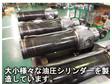
大小様々な油圧シリンダーを製造しています。