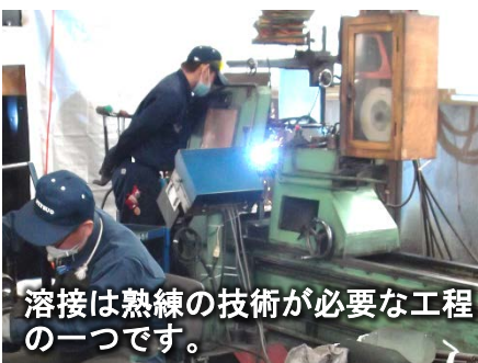
溶接は熟練の技術が必要な工程の一つです。

地元の若い方も採用し、人材育成にも力を注いでいきたいと考えています。 工場の再開を待ってくれていた従業員と共にこの地で着実に事業を進めていきたいと考えています。