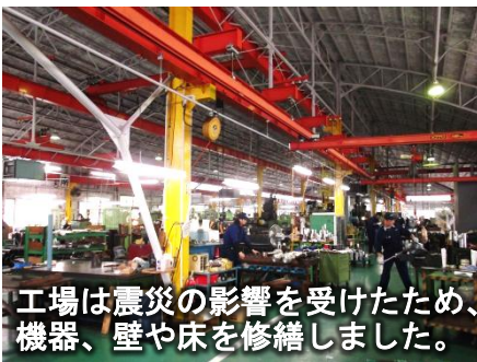
工場は震災の影響を受けたため、機器、壁や床を修繕しました。

震災後、ここは避難指示区域に指定され、工場の一部も損傷を受けていたため、操業を休止していました。震災1年半後から5名の従業員にて工場の片付けや修繕をし、グループ企業など他の工場で製造されたものの組み立てを行っていました。その後、国や県の補助金制度も活用して工場建屋や設備を整備し、本年3月から従業員35名にて事業を本格的に再開することができました。再開に至るまでの間、グループ企業が代替生産を行うことにより顧客を維持する等、本社、グループ企業を含め会社一丸となったことが再開の原動力となりました。目下の課題は従業員の確保ですが、