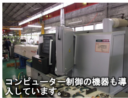
コンピュータ制御の機器も導入しています。