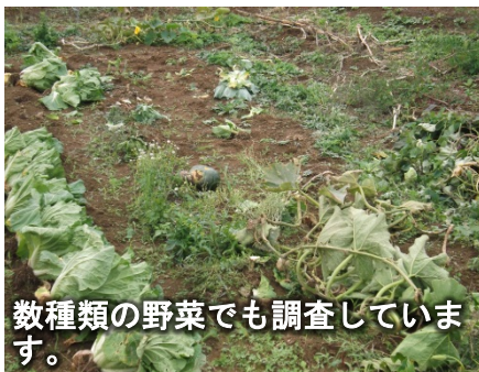
数種類の野菜でも調査しています。

り、カリウム肥料が作物に与える影響が異なることにも着目しています。このため、継続的に試験に取り組むことにより、将来の営農再開につなげられればと考えています。