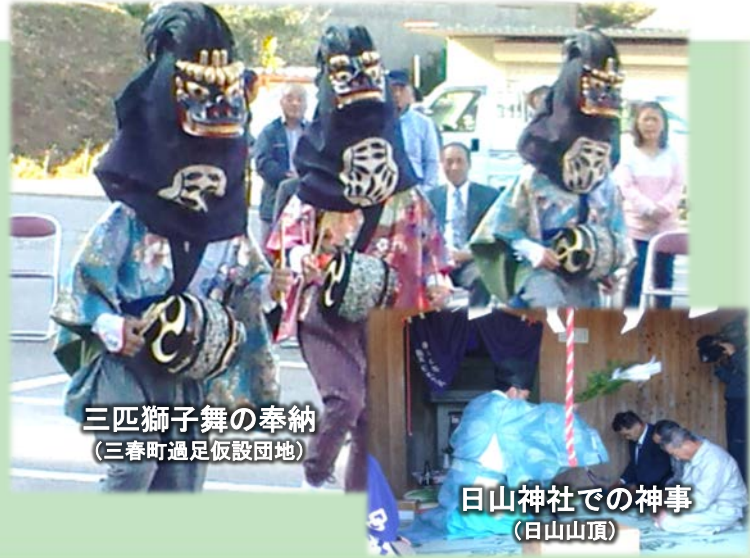
三匹獅子舞の奉納 (三春町過足仮設団地)

『日山神社例大祭』が厳かに行われました。「日山」山頂での祭祀は震災後、初めてとなります。